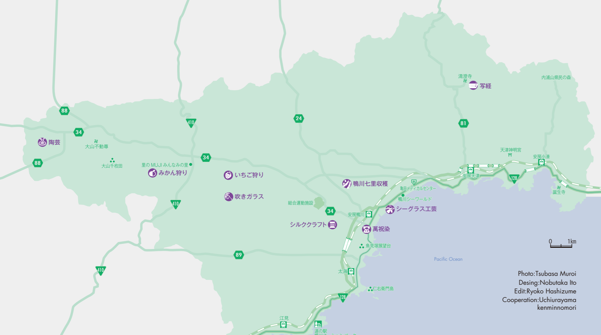
Desing:Nobutaka Ito Edit:Ryoko Hashizume Cooperation:Uchiurayama kenminnomori